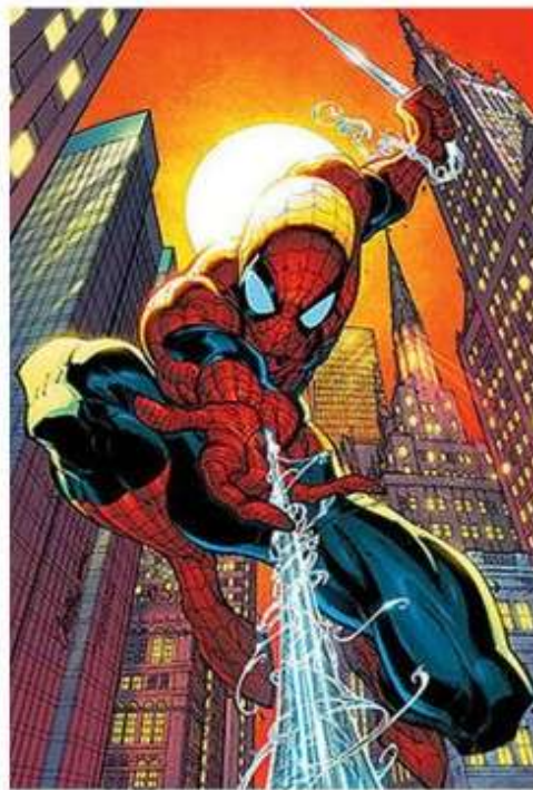
Promotional art for The Amazing Spider-Man vol. 2, #50 (April 2003) by J. Scott Campbell and Tim Townsend

S pider-Man is a fictional comic book superhero published by Marvel Comics. Created by Stan Lee and Steve Ditko, since his first appearance in Amazing Fantasy #15 (Aug. 1962), Spider-Man has become one of the world's most popular, enduring and commercially successful superheroes and is arguably Marvel's most famous character.