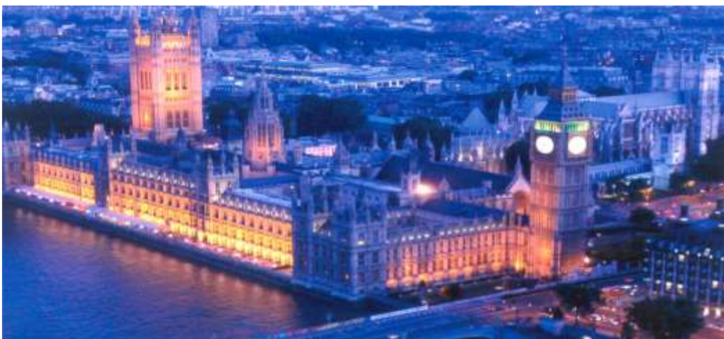
The Big Ben and Parliament