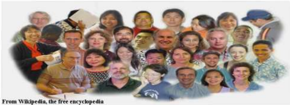
From Wikipedia, the free encyclopedia

Lee el siguiente artículo y observa la información que se encuentra en la gráfica. Responde las preguntas que se te hacen a continuación.